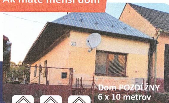
Dom POZDÍŽNY 6 x 10 metrov