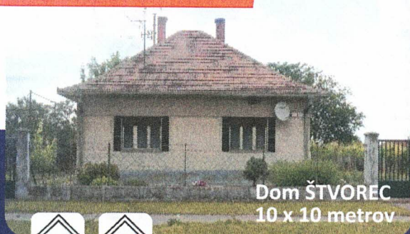
Dom ŠTVOREC 10 x 10 metrov